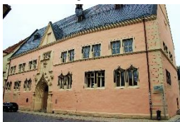
Alte Universität Erfurt

immer entlang der Gera, vorbei an Walsleben, Elxleben und Kühnhausen durch Gispersleben wieder zurück in das Zentrum der Landeshauptstadt Thüringens.