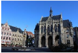
Rathaus & Fischmarkt Erfurt