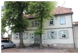
Historisches Pfarrhaus Stotternheim