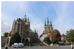
Dom St. Marien & St. Severi Erfurt