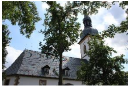
St. Peter & Paul Kirche Stotternheim