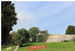
Zitadelle Petersberg Erfurt