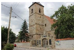
St. Michaelis-Kirche Elxleben