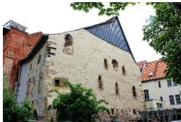
Alte Synagoge Erfurt